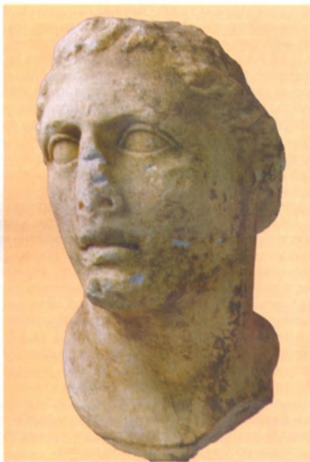
Голова Митридата VI Евпатора. Известняк. (132 – 63 гг. до н. э.) II – I вв. до н. э. Государственный Эрмитаж.

свидетельствует о ее возросшем экономическом благополучии и большой роли в экономической жизни Боспора.