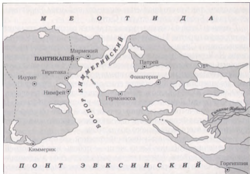
Боспорское царство и наиболее крупные города

В первой четверти V в. до н. э., около 480 г. до н. э., греческие полисы Боспора Киммерийского, расположенные по обе стороны Керченского пролива, объединились под главенством Пантикапея. Из отдельных самостоятельных городов-государств создавалось