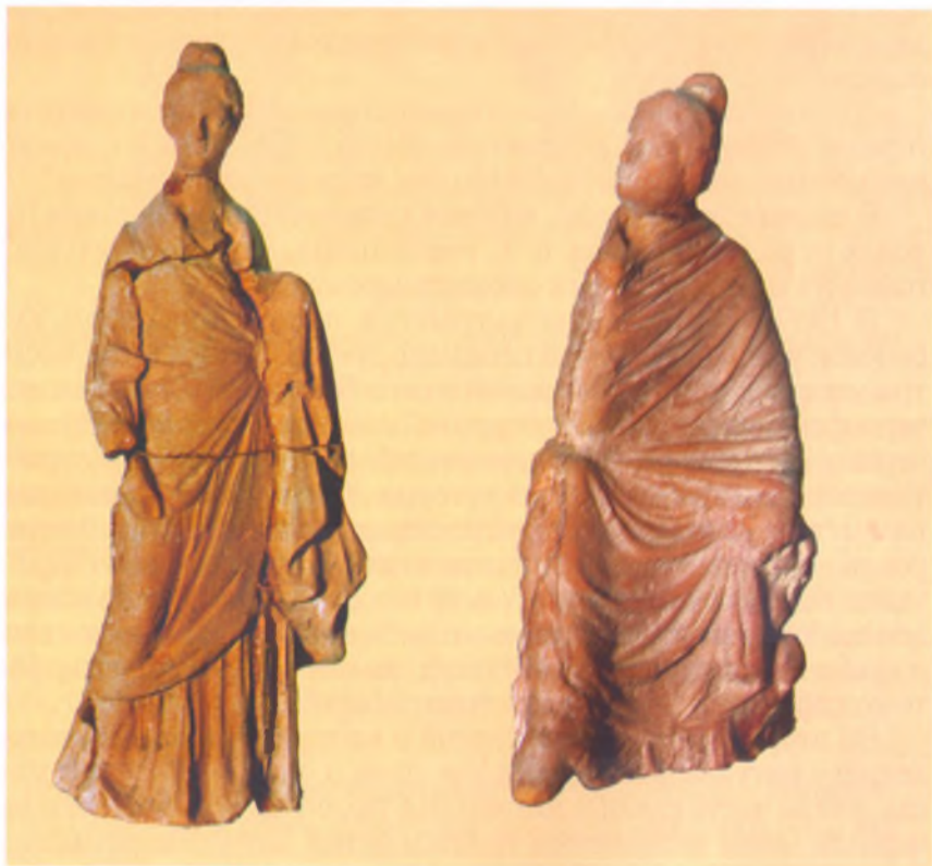
Статуэтки из могилы № 4. Глина. III в. до н. э. Анапский археологический музей

Другое погребение, возраст которого насчитывает 1700 лет, было более богатым. Земляную могилу перекрывали шесть бревен и доски. На голову умершему был надет золотой венок в виде тонкой золо-