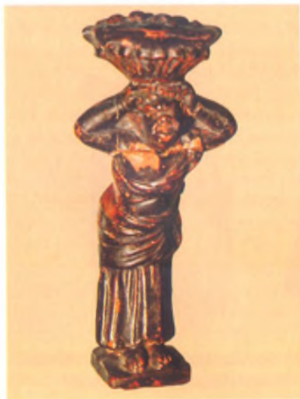
Светильник II в. до н. э. в форме статуэтки рабыни с корзиной. Анапский археологический музей.

Сохранилось несколько бронзовых монет IV и III вв. до н. э., упавших на пол. Но особенно интересна статуэтка из глины розового цвета, покрытая блестящим черным лаком, изображающая рабыню – негритянку, которая держит на голове корзину с фруктами. Женская фигурка являлась основанием светильника, сделанного в виде корзины. На верхнем щитке его были оттиснуты рельефные яблоки и груши. Через небольшой носик в сосуд пропускали фитиль, который и зажигали. Простые, без статуэток глиняные светильники, иногда даже с обуглившимися фитилями из скрученной шерстяной ткани, очень часто находили при раскопках Анапы и других боспорских поселений.