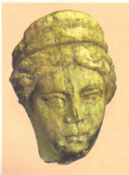
Головка Афродиты. Мрамор. II в. н. э. Анапский археологический музей.

Один из главных праздников в честь Исиды справлялся греками весной при открытии навигации. Его описание сохранилось у Апулея, который рассказывает о том, как длинная блестящая процессия направилась к морю, чтобы посвятить богине священный корабль. Впереди шли мужчины и женщины, одетые в белоснежные льняные одежды, и потрясали цистами – музыкальными инструментами,