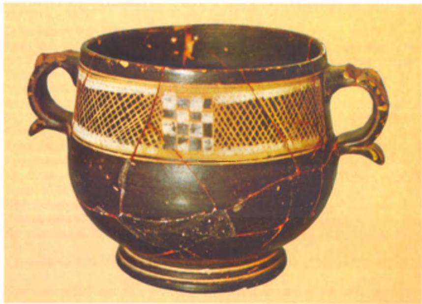
Аттический кубок. II в. до н. э. Анапский археологический музей.