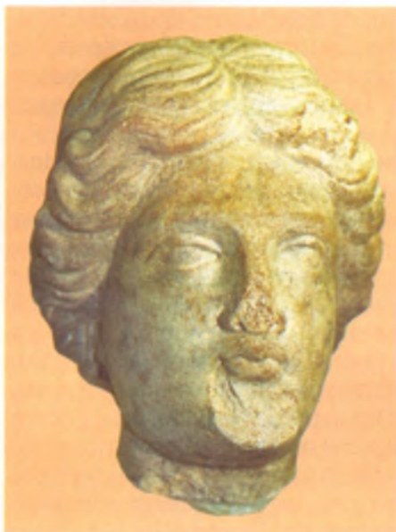
Головка Афродиты. Мрамор. I в. н. э. Анапский археологический музей.

Афродита почиталась во всех греческих государствах как покровительница любви, моряков и как богиня неба. Римляне называли ее Венерой. До нас дошло множество ее изображений, сделанных из глины, бронзы и мрамора. Существовали храмы, посвященные Афродите.