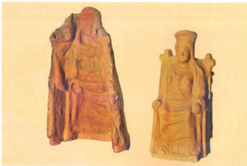
Форма для оттискивания статуэтки богини, сидящей на кресле II в. до н. э. и оттиск с нее. Анапский археологический музей.

Подобные культовые статуэтки жители Горгиппии приносили в храмы, желая умиловить богов. Поэтому спрос на них был велик. Гончар в одной и той же форме, как правило, оттискивал