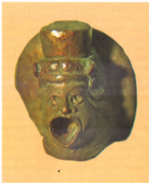
Кран сосуда. Бронза. I в. н. э. Анапский археологический музей.

Среди бытового инвентаря из горгиппийских домов очень большое место занимают глиняные светильники. Они представляют собой сосуд для масла с маленькой округлой ручкой, носиком, в который вставлялся фитиль. Иногда светильник имеет приделанную к нему высокую гофрированную подставку. Чаще встречаются небольшие закрытые светильники с рельефным щитком, характерным для первых веков нашей эры.