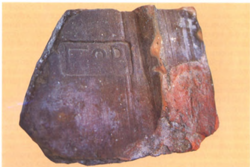
Клеймо на горгиппийской черепице. IV в. до н. э. Анапский археологический музей.

посуды. В городе имелись также металлургические, камнерезные и другие ремесленные мастерские. Горгиппия являлась не только торговым и ремесленным центром Боспора, но и одной из его пограничных крепостей.