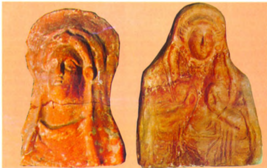
Протома Коры-Персефоны. Глина. III в. до н. э. Анапский археологический музей.

Вместе с изображением Деметры и Персефоны были найдены сосуды, покрытые черным лаком. На доньшках некоторых из них процарапаны имена богов, которым приносили жертвы, или начальные буквы имен жертвователей. По-видимому, Деметре не только приносили в жертву колосья, но делали возлияния вина на алтаре у ее храма (сосуды после возлияний оставляли богине).