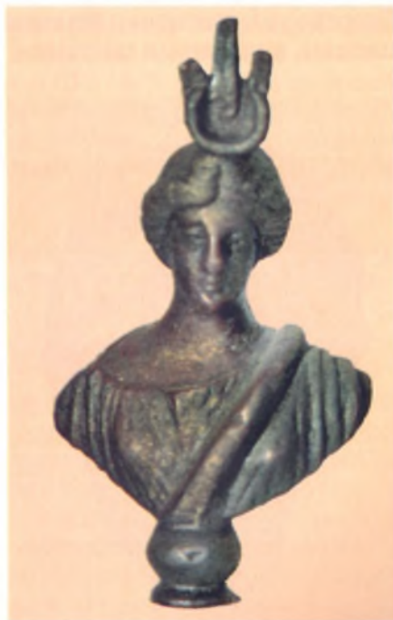
Бюст Афродита-Исиды. Бронза. III в. н. э. Анапский археологический музей.

Особенный интерес представляет небольшой бронзовый бюст Афродиты со стилизованными рогами в виде полумесяца, обращенного вверх, и тремя перьями мудрости. Такие перья мы видим на голове египетских богов Беса, Исиды, Гарпократа. Наличие у Афродиты атрибутов Исиды, египетской богини земледелия, показывает, что в Горгии, как и во всей Римской империи во II – III вв. н. э., распространились синкретические культы.