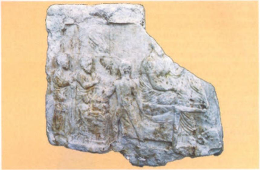
Рельеф со сценой погребального пира. Мрамор. IV в. до н. э. Анапский археологический музей.

ограничивают пространство, заставляя зрителя думать, что загробный пир происходит в храме, или герооне, что главным персонажем является божество или героизированный умерший.