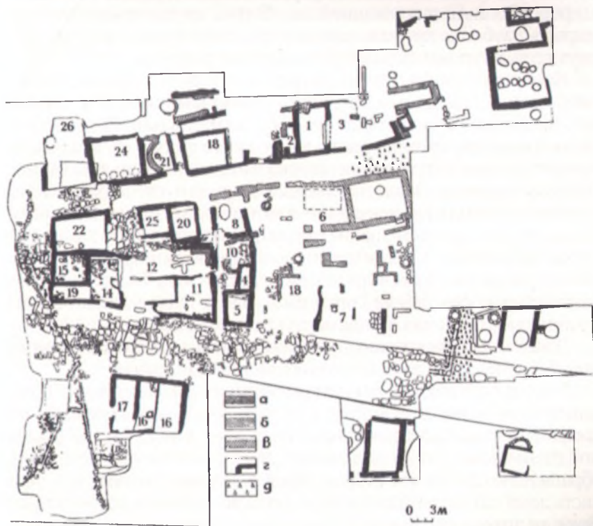
План раскопа «Город». Археологический заповедник «Горгиппия»: а – кладки IV – III вв. до н. э.; б – стены II в. до н. э.; в – стены I в. н. э.; г – стены II – III вв. н. э.; д. – черепяная вымостка; 1–26 – номера помещений.

Это совпало, вероятно, с гибелью всего жилого квартала на этом участке в III в. н. э. У магистрального канала имелись ответвления. Все они были направлены к западу, к центральной части города. Но раскопки в этом направлении расширить оказалось невозможным, и длину боковых ответвлений канала узнать, пока не удалось. Все они подводили к главному каналу воду с отдельных участков. К северу и к югу от магистральной улицы