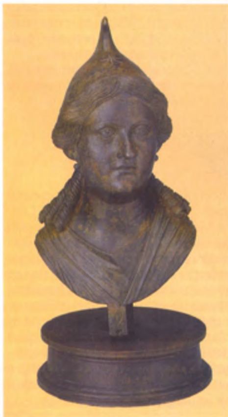
Бюст царицы Динамии. Бронза. I в. до н. э. Государственный Эрмитаж.

Сопоставление различных фактов привело ученых к мнению, что Динамия умерла в 12 г. до н. э. А в 13 или в 14 г. н. э. царем Боспора стал Аспург, которого многие исследователи считают сыном Динамии и Асандра, хотя имеются и другие точки зрения.