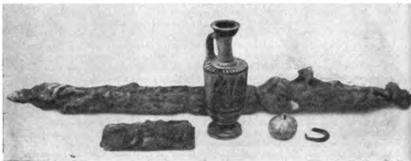
Рис. 19. Вещи из погребений: бусина из погребения № 1; меч, лениф, серебряное кольцо, обломок каляя из погребения № 10