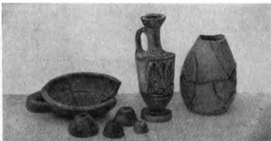
Рис. 18. Вещи из погребения № 9