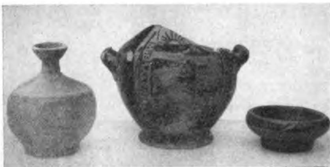
Рис. 17. Находки из погребения № 1