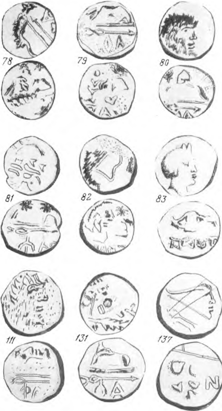
Монеты клада из пос. Виноградского (прорисовки монет увеличены в 2 раза)