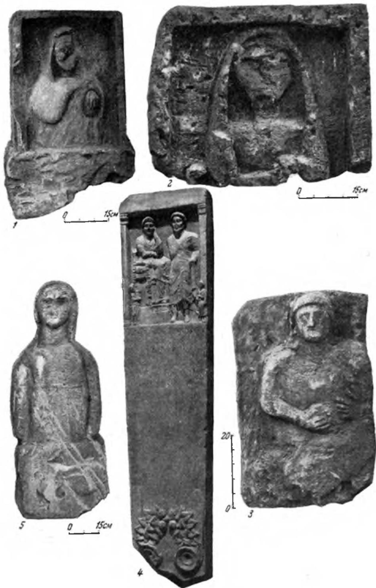
Рис. 2. Надгробия из случайных находок в Горгиппии

1, 3 — Новороссийская ул., 19; 2 — Крымская ул., 92; 4 — угол улиц Шевченко и Астраханской; 5 — восточная окраина Алены