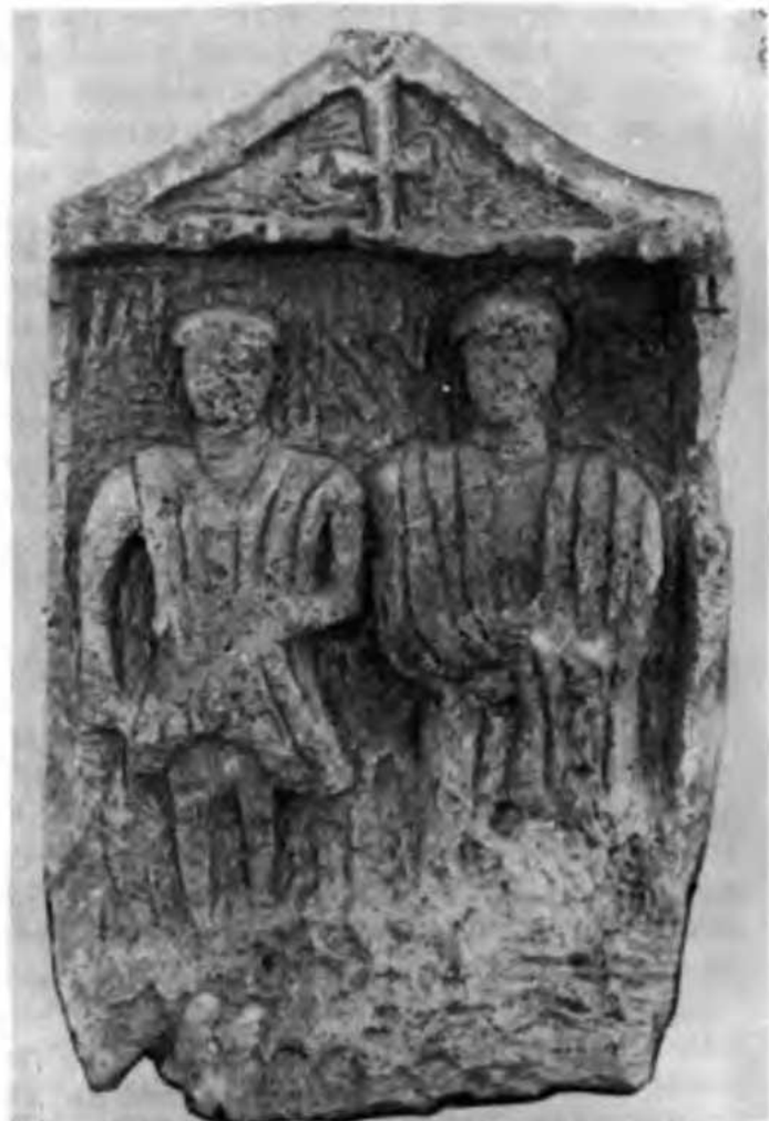
Рис. 3. Надгробие с крестом

Рельеф исполнен в традициях позднесарматского Боспора. Датировку его (IV в. до н. э.) уточняет крест — знак, который с этого времени стал изображаться в христианской символике. О форме креста Ю. А. Кулаковский в свое время писал: «Три верхние конца имеют приблизительно равную длину, а нижний — почти в два раза длиннее. Все концы заканчиваются треугольным расширением в обе стороны. Эта форма креста засвидетельствована на множестве памятников V—VI вв. по всему христианскому миру» 5 . Наше изображение укладывается