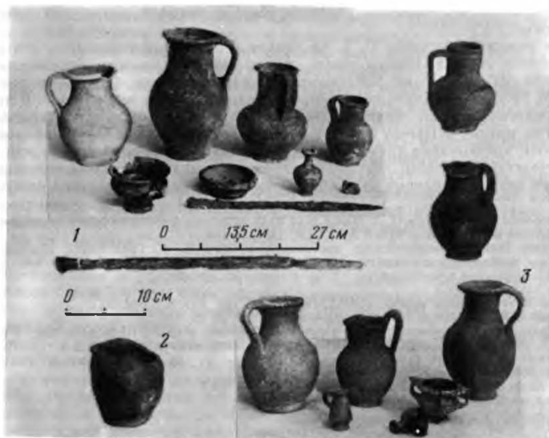
Рис. 1. Находки из могильника у Красного Кургана

Среди наиболее интересных находок надо отметить меч и небольшой горшочек (рис. 2). Горшочек вылеплен из темно-серой глины с включениями