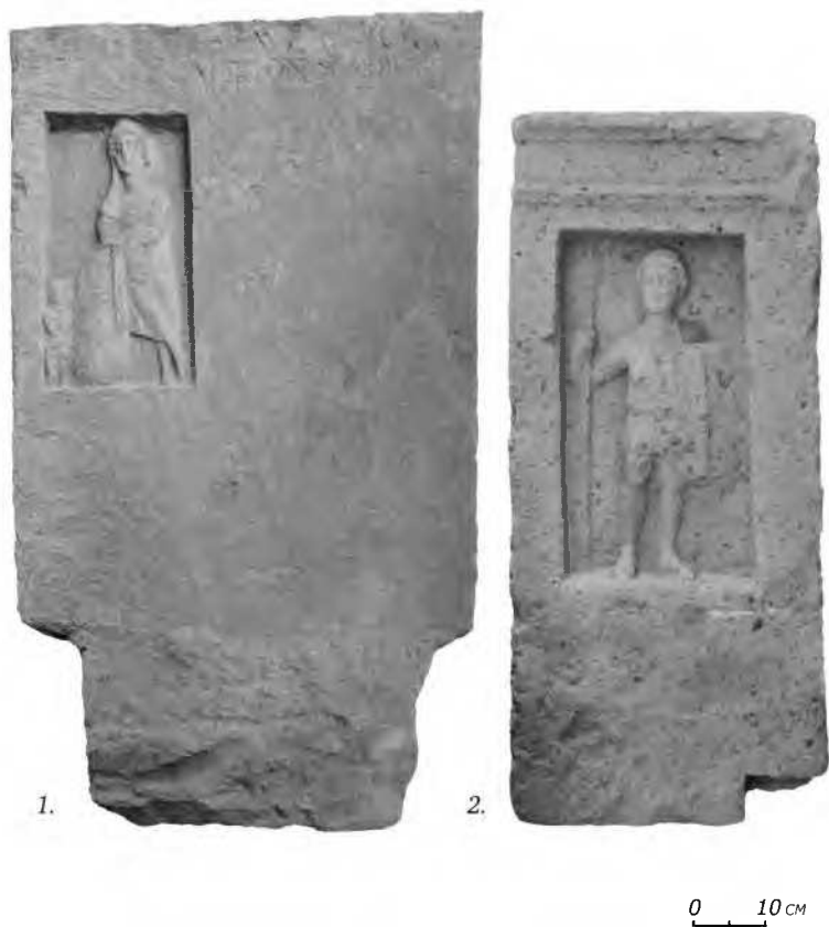
Рис. 1. Горгиппийские надгробия с изображением пеших воинов со щитом.