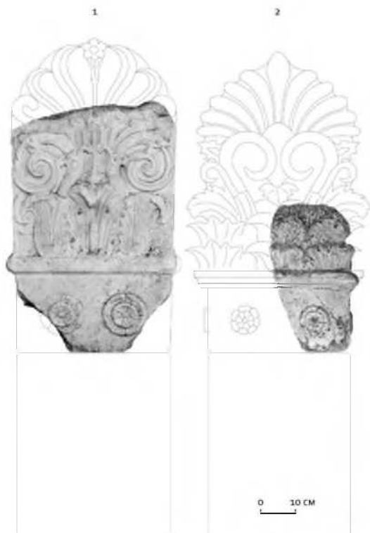
Рис 1. Мраморные акротерии из коллекции Анапского археологического музея.

Устаева Э.Р. Журавлев Д.В. Таманский музейный комплекс // Античное наследие Кубани. Том II. М., 2010.